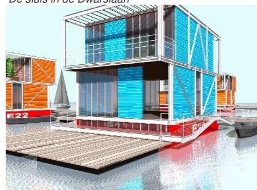
Impressie van de drijvende "solo" woning