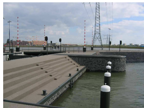
De sluis in de Dwarslaan

Indien u geen informatie meer wenst te ontvangen, verzoeken wij u ons dit per e-mail ( info@waterbuurtwest.nl ) te laten weten