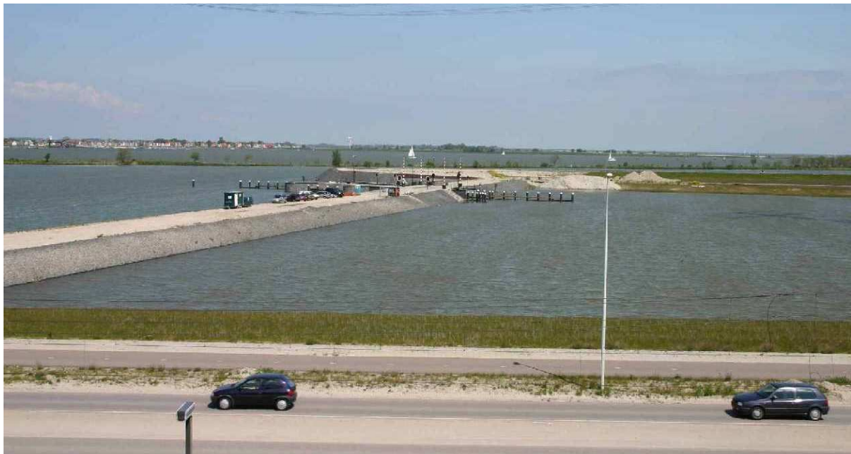
Zicht op de Waterbuurt West vanaf de Steigerdam (IJburglaan), met links de Dwarslaan en de nieuwe sluis.

Het heeft nogal wat voeten in de aarde gehad, maar een paar weken geleden kon eindelijk de principeovereenkomst voor de bouw van de Waterbuurt West met Gemeente Amsterdam worden aangegaan! Direct daarna is iedereen volop aan de slag gegaan om het project nu zo snel mogelijk van de grond te krijgen (en het water in). Dat betekent dat bij vlote doorloop begin volgend jaar met de bouwvoorbereiding wordt gestart en dat korte tijd daarna de verkoop van de appartementen in het "kadegebouw" kan starten. Het kadegebouw zal als eerste verrijzen en dan de paalwoningen langs de dijk van de Dwarslaan en daarna worden de steigers aangelegd waaraan de drijvende woningen afgemeerd zullen worden.