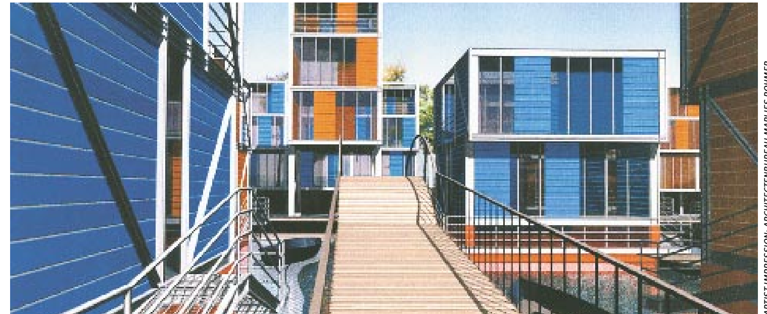
ARTIST IMPRESSION: ARCHITECTENBUREAU MARLIES ROHMER